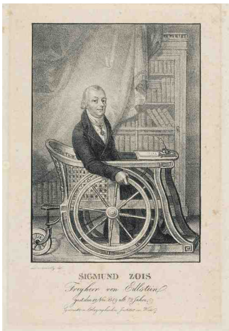
BARON ŽIGA ZOIS NA VOZIČKU, KI SI GA JE ZAMISLIL SAM IN KI JE SHRANJEN V MESTNEM MUZEJU V LJUBLJANI