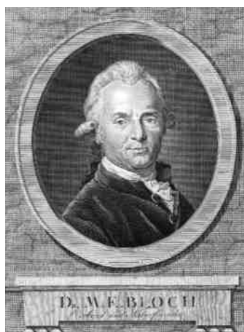
PORTRET BERLINSKEGA ZDRAVNIKA MARCUSA ELIESERJA BLOCHA IZ LETA 1794 JE NATISNEN V ZADNJEM DELU NJEGOVE PUBLIKACIJE O RIBAH.

Na bakrorezu s kirnjico je še nekaj, kar pritegne našo pozornost – napis »Gestochen auf Kosten von B. S. Z. in Laibach« pod sliko ribice. Kdor zna nemško, ve, da to pomeni »Vrezano na stroške B. S. Z. v Ljubljani«. Kdo neki je bil ta Ljubljčan, ki je iz lastnega žepa plačal stroške vrezovanja slike kirnjice v bakreno ploščo, a ni želel, da bi bilo njegovo ime na njej izpisano v celoti? Ni dvoma, da gre za barona Žigo Zois, ki ga sicer imenujemo Žiga, a se je sam podpisoval Sigmund. Tudi ugovor, češ da so nosilce baronskega naslova v Zoisovem času označevali z besedo Freiherr , ne drži. Uporabljala sta se oba nemška izraza za naslov baron, Freiherr in Baron . B. S. Z. je torej treba razvozlati kot Baron Sigmund Zois.